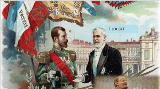
Le Tsar à Paris en 1901

Pour la police : Fichée. Considérée mineure dans l'organisation.