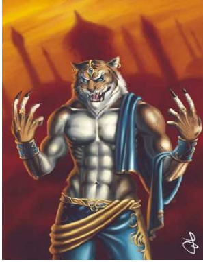
Moi sous ma vraie apparence (Elminster me connaît comme cela)