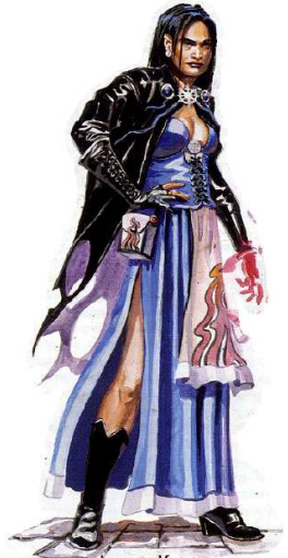
Mon apparence Humaine (qui est l'avatar de Mystra elle-même) (j'ai pris cette apparence instinctivement sans y réfléchir)