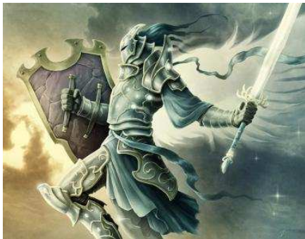
Moi lorsque j'étais Paladin